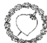
Cofradía de Nuestra Señora de las Angustias