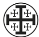
Cofradía de Nuestra Señora de la Soledad y del Santo Entierro