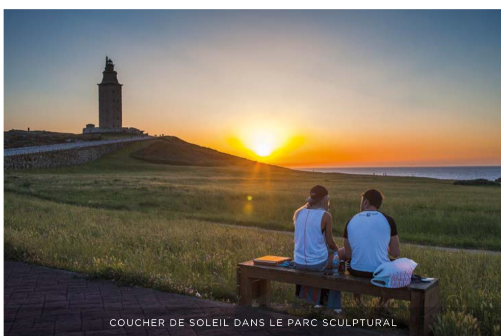
COUCHER DE SOLEIL DANS LE PARC SCULPTURAL

Ce parc-musée, situé dans le golfe Artabre, s'étend sur la péninsule de la Tour, la pointe Herminia, O Acoroado et le Cabal de Pradeira. Les sculptures sont réparties de manière à composer un jeu de perspective très suggestif, dans un dialogue permanent avec le monument de la tour d'Hercule. Ce parc est constitué de falaises, d'îlots, de grottes marines, appelées en Galice « furnas », et de petites plages.