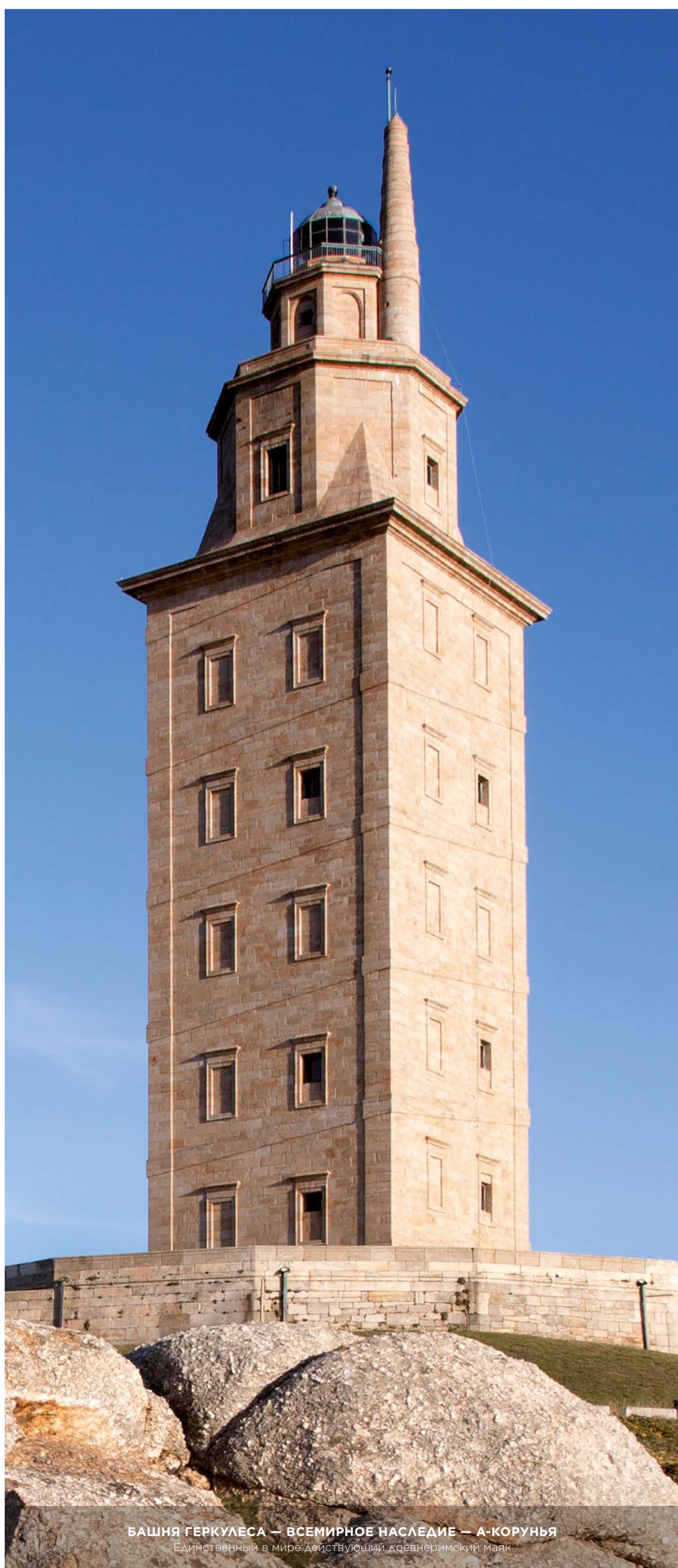
БАШНЯ ГЕРКУЛЕСА — ВСЕМИРНОЕ НАСЛЕДИЕ — А-КОРУÑА Единственный в мире действующий древнеримский маяк