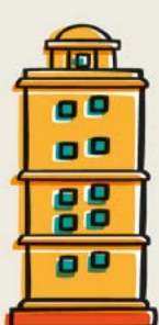
I век Предполагаемый первоначальный вид