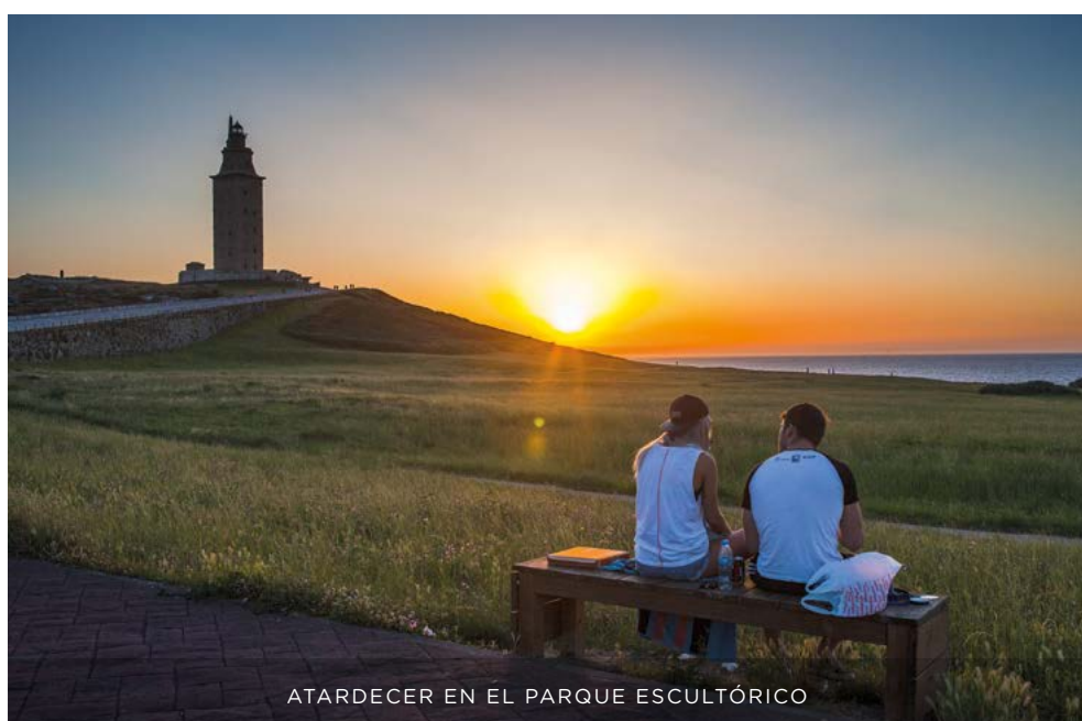
ATARDECER EN EL PARQUE ESCULTÓRICO